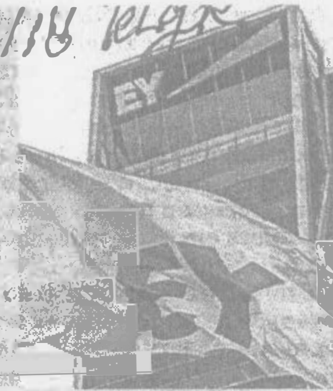
EY tussen hamer en aanbeeld

Het jaarverslag over 2016 werd niet langer door EY gecontroleerd, maar door KPMG. Daarin duikt voor het eerst de melding op van een onderzoek van het OM naar ING. KPMG zegt in een reactie daarmee vol-